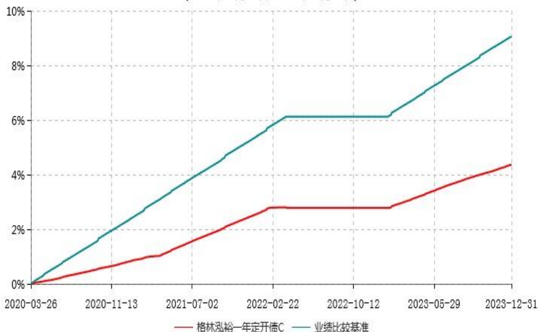
格林泓裕一年定开债C累计净值增长率与业绩比较基准收益率历史走势对比图 (2020年03月26日-2023年12月31日)

注：根据《格林泓裕一年定期开放债券型证券投资基金基金合同》约定，经向中国证监会备案，基金管理人于 2022 年 3 月 29 日发布《关于格林泓裕一年定期开放债券型证券投资基金第二个开放期到期后暂停运作、不进入下一封闭期的公告》，本基金于 2022 年 3 月 29 日起暂停运作。经与基金托管人协商一致，并报中国证监会备案，基金管理人于 2023 年 1 月 13 日发布《关于格林泓裕一年定期开放债券型证券投资基金恢复运作并开放申购、赎回及转换业务的公告》，本基金自 2023 年 1 月 13 日起恢复本基金的运作并开放申购、赎回及转换业务。份额净值增长率和业绩比较基准收益率均按实际存续期计算。