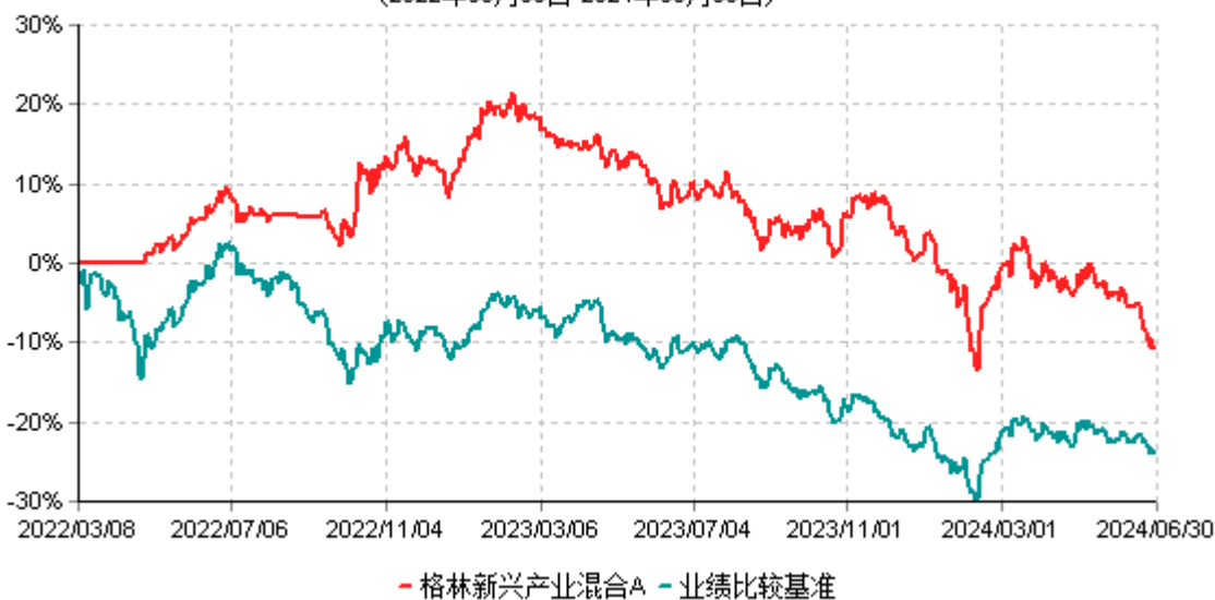
格林新兴产业混合A累计净值增长率与业绩比较基准收益率历史走势对比图 (2022年03月08日-2024年06月30日)